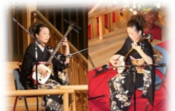
쓰가루 샤미센 라이브