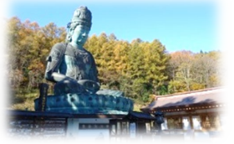
세이류지 절(좌상 일본 제일)