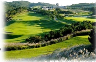
나쓰도마리 골프 링크스